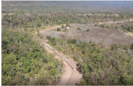
รูปที่ 1.7-9 ความก้าวหน้าการก่อสร้างท่อส่งน้ำสาย 2R-LMP กม.3+500 – กม. 4+500