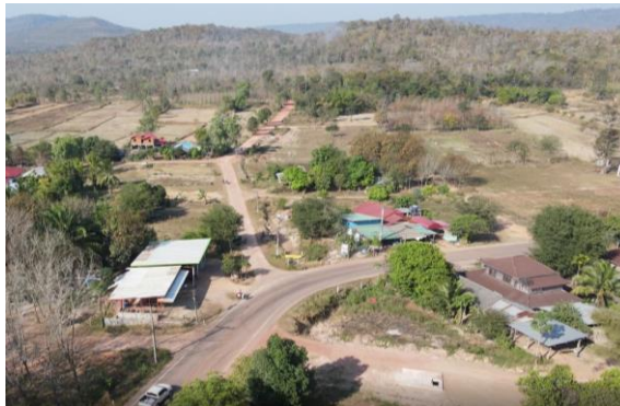
รูปที่ 1.7-11 ความก้าวหน้าการก่อสร้างท่อส่งน้ำสาย 3R-LMP กม.0+000 – กม. 0+500