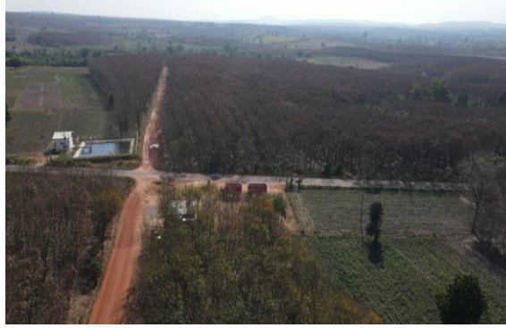
รูปที่ 1.7-4 ความก้าวหน้าการก่อสร้างท่อส่งน้ำสาย LMP กม.7+000 – กม. 7+557