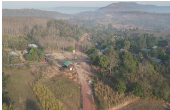
รูปที่ 1.7-6 ความก้าวหน้าการก่อสร้างท่อส่งน้ำสาย 2R-LMP กม.0+000 – กม. 0+360