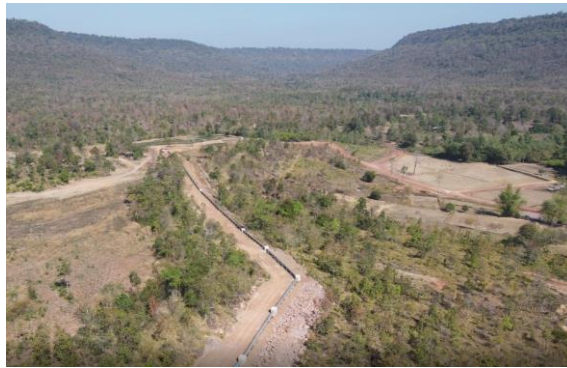
รูปที่ 1.7-10 ความก้าวหน้าการก่อสร้างท่อส่งน้ำสาย 2R-LMP กม.5+000 – กม. 5+592