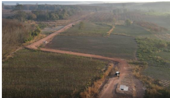
รูปที่ 1.7-1 ความก้าวหน้าการก่อสร้างท่อส่งน้ำสาย LMP กม.0+000 – กม. 0+700