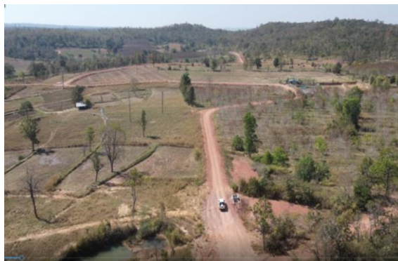
รูปที่ 1.7-7 ความก้าวหน้าการก่อสร้างท่อส่งน้ำสาย 2R-LMP กม.2+000 – กม. 2+500