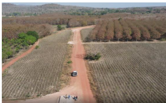
รูปที่ 1.7-3 ความก้าวหน้าการก่อสร้างท่อส่งน้ำสาย LMP กม.5+000 – กม. 5+700