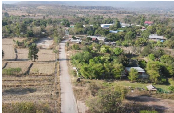
รูปที่ 1.7-5 ความก้าวหน้าการก่อสร้างท่อส่งน้ำสาย 1R-LMP กม.0+000 – กม. 0+400