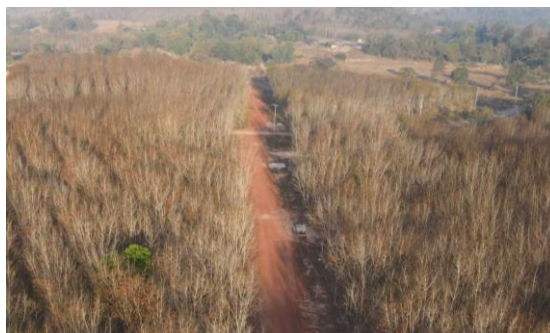
รูปที่ 1.7-2 ความก้าวหน้าการก่อสร้างท่อส่งน้ำสาย LMP กม.1+800 – กม. 2+400