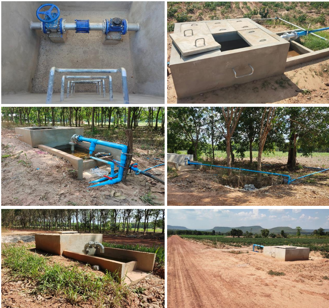
รูปที่ 1.7-13 งานอาคารหัวจ่ายน้ำ (ดำเนินงานแล้วเสร็จ)