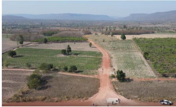
รูปที่ 1.7-12 ความก้าวหน้าการก่อสร้างท่อส่งน้ำสาย 4R-LMP กม.0+000 – กม. 1+000